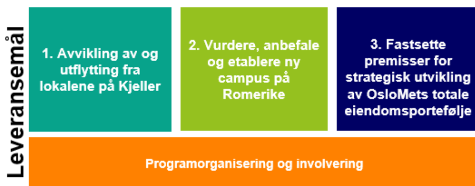
Figur 1: Leveranssmål Campusprogrammet

Som følge av styrets vedtak og endringer i eiendomsporteføljen de kommende årene, vil hovedpunkter i programmets innhold være ivaretagelse av flytting fra Campus Kjeller, etablere Campus Romerike og samtidig vurdere OsloMet sin virksomhet som helhet, se figur 1. Vurderingene som ligger til grunn skal være basert på en helhetlig og brukerorientert vurdering av hvordan fagmiljøer og virksomhet ved OsloMet kan lokaliseres på en mest mulig hensiktsmessig måte. Programmets leveranser skal bidra til å sikre en tydelig sammenheng mellom eiendomsporteføljen og utdannings- og forskningskvalitet og er tett knyttet til OsloMet sine langsiktige strategiske valg som skal bidra til å styrke universitetets økonomiske handlingsrom.